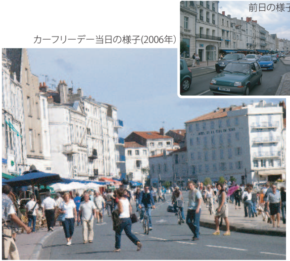
カーフリーデー当日の様子(2006年)

学校、家族、地域住民は、歩数チャレンジやモビリティ競技に参加し、専門家が自転車文化や都市計画について議論する会議やワークショップも開催されました。さらに、新しい自転車インフラや時速30キロ制限区域といった恒常的施策により、リガはより安全で人を中心とした街づくりへの取り組みを強化しました。